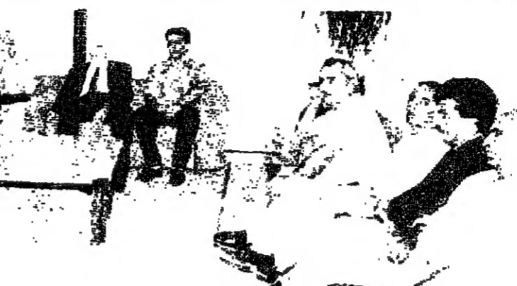
الهراوي مستقبلاً عسيران والوفد

ناتي من اقليم النجاش الجريح نتيجة حرب عنيفة دموية بين اخوة السلاح، ناتي اليكم ونحن نحمل معنا هموم وعذابات اهنا في الاقليم من جراء هذه الحرب. هذه الحرب التي ادت الى قتل وتشريد وتهجير وتدمير هذه الحرب التي نرفض منطلق ادلائها ومنطق استمرارها، هذه الحرب التي تقدم عبرنا خدمة مباشرة واكيدة للعدو الصهيوني. ونحن نكثج علينا لاهالي اقليم النجاش حولنا جاهدين لمنع اشراخ هذه الحرب عما تحول الان ايضاً ترها. استقبل الرئيس الياس الهراوي ظهر اسس الرئيس عادل عسيران مع وفد من اللجنة العليا لاهالي اقليم النجاش، وجرى عرض الوضع في المنطقة خصوصاً لجهة تنفيذ قرار حكومة الحص بتسليم الجيش مهام الامن في اقليم النجاش. وخلال اللقاء الذي حضره اللجنة العليا لاهالي اقليم النجاش السيد شوقي عسيران كلمة جاء فيها: فخامة الرئيس، ناتي اليكم من اقليم النجاش بعد تهجير قسري قارب العشرة اشهر ولا ينه بعد.